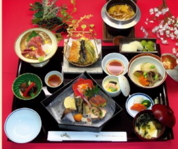
会席膳 松 3,800円 税込/サ別