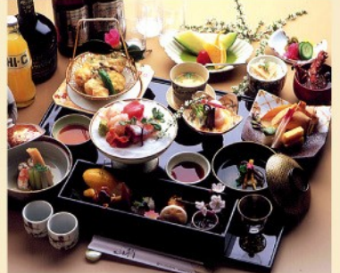
会席膳 音羽 5,000円 税込/サ別