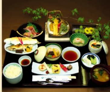
会席膳 梅 2,800円 税込/サ別