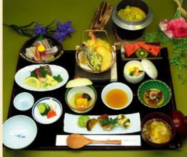
会席膳 竹 3,200円 税込/サ別