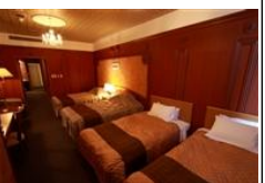
シングルルーム (1名様)