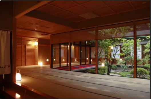
畳廊下 ここはゆったりと時間が流れていま