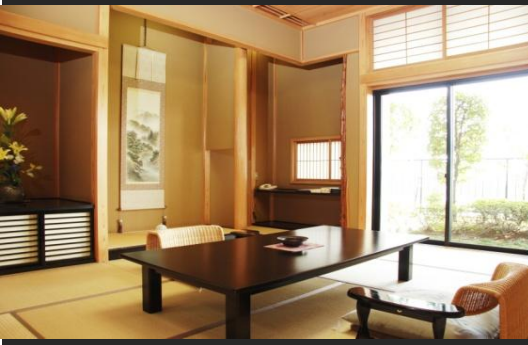
全客室とも和室と洋室を1部屋に完備92㎡