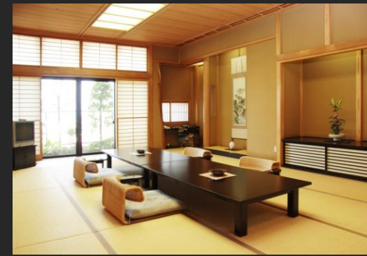
全客室とも和室と洋室を1部屋に完備103㎡客