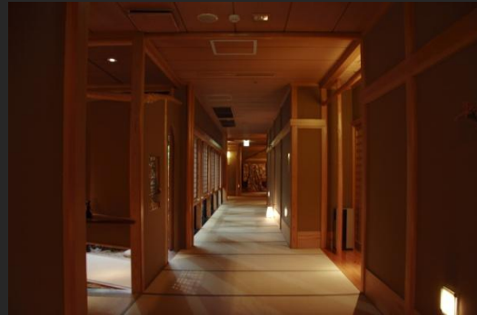
あえて10室の客室へと続く畳廊下