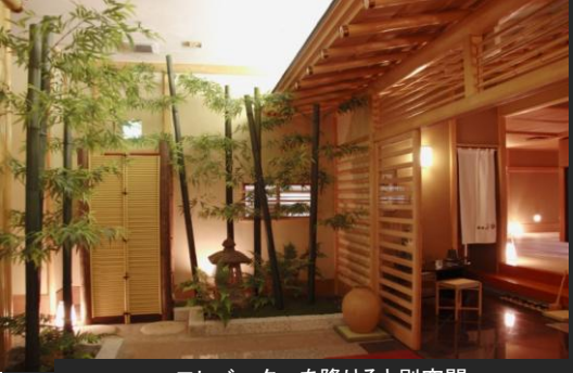
エレベーターを降りると別空間