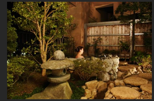
全客室室内浴槽と客室露天風呂を完備