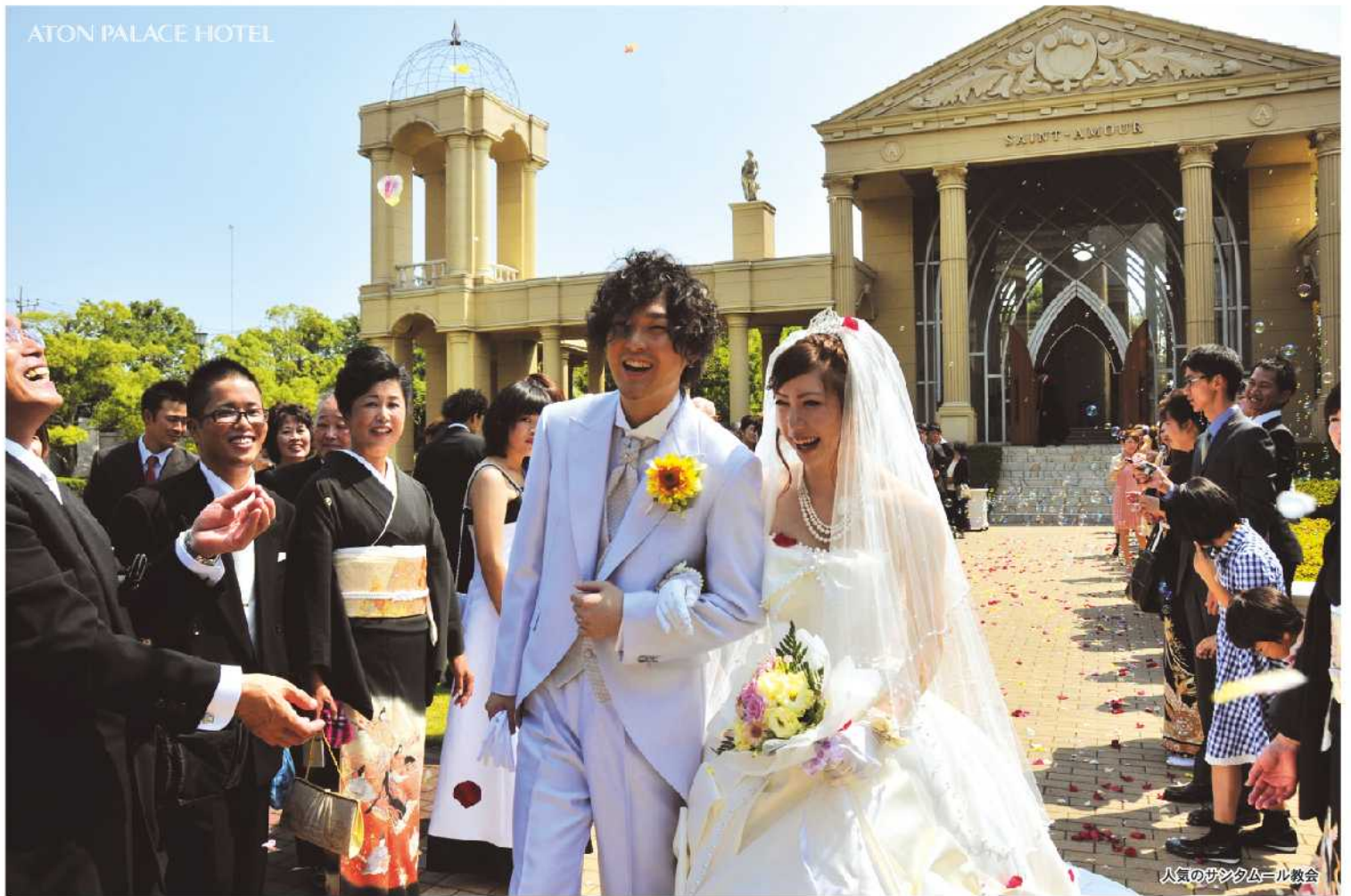
人気のサンタムール教会