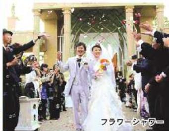
フラワーシャワー