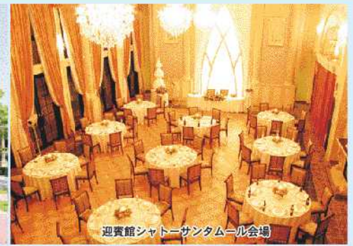
迎賓館シャトーサンタムール会場