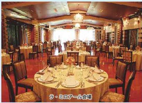
ラ・ミロアール会場