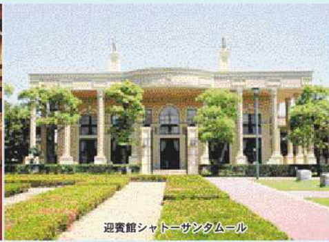
迎賓館シャトーサンタムール