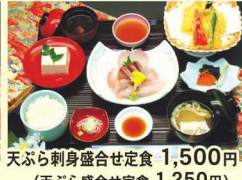
天ぷら刺身盛合せ定食 1,500円 (天ぷら盛合せ定食 1,250円)