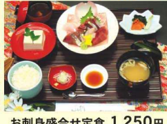
お刺身盛合せ定食 1,250円