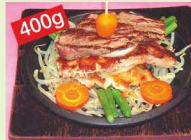
400g 牛ステーキミックス