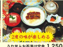
うな丼とお茶漬け定食 1,250円