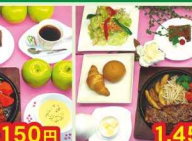
1,150円 イタリアンハンバーグセット