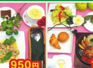
950円 パスタおすすめセット