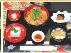
豚生姜焼き丼定食 650円