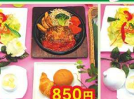
850円 イタリアンハンバーグ