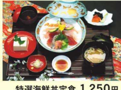
特選海鮮丼定食 1,250円