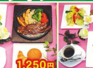
1,250円 牛リブコースステーキ