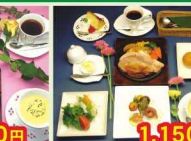
1,450円 牛リブコースステーキセット