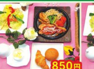
850円 茨城産ローズポークソテー