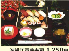
海鮮江戸前寿司 1,250円