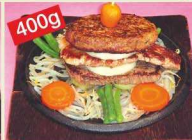
400g ハンバーグステーキミックス