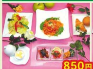
850円 店長のおすすめパスタ