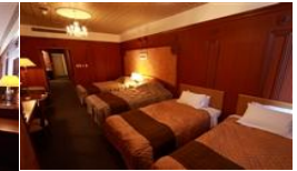
ファミリールーム (3名様～5名様)