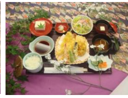
天ぷら盛り合わせ定食