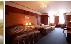
デラックスツイン (2名様)