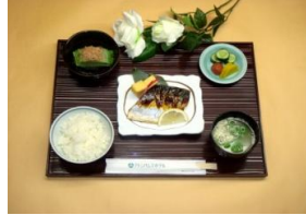
ご宿泊プラン和食