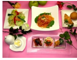
店長お薦めパスタ