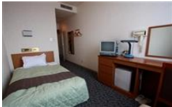
シングルルーム (1名様)