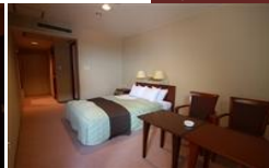
ダブルルーム (2名様)