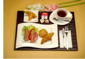
ご宿泊プラン洋食