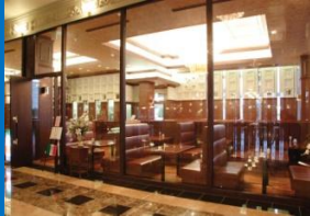
朝食会場 ルピナス

朝食ご案内 会場 『洋食 ルピナス』 本館1階 時間 6時30分～9時 ラストオーダー8時30分