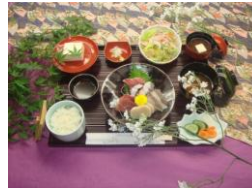
お刺身盛り合わせ定食